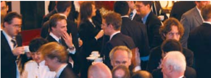
ABB • Airbus • Alstom • Arup • BT • Bayer • AXA • Deloitte • Deutsche Bank • BP • EON • Gazprom • GE • Globus Sberbank • IBM • Kraft • KPMG • Lufthansa • Miele • Mouchel • Munich Re • Nokia • Novartis • Siemens • Thyssen VTB и многие другие

Ежегодно более 80% из 500 ведущих Европейских компаний являются участниками конференции C5: